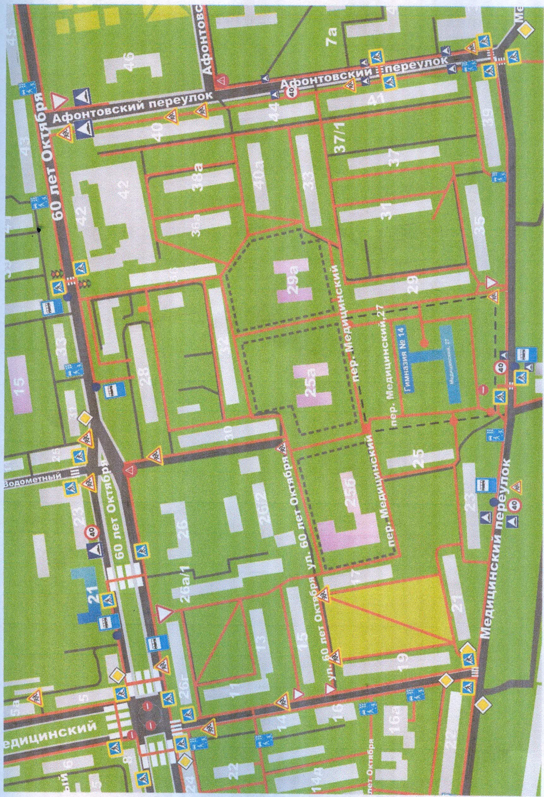
Схема организации дорожного движения в непосредственной близости от МАОУ Гимназия №14 с размещением соответствующих технических средств, маршруты движения детей и расположение парковочных мест.